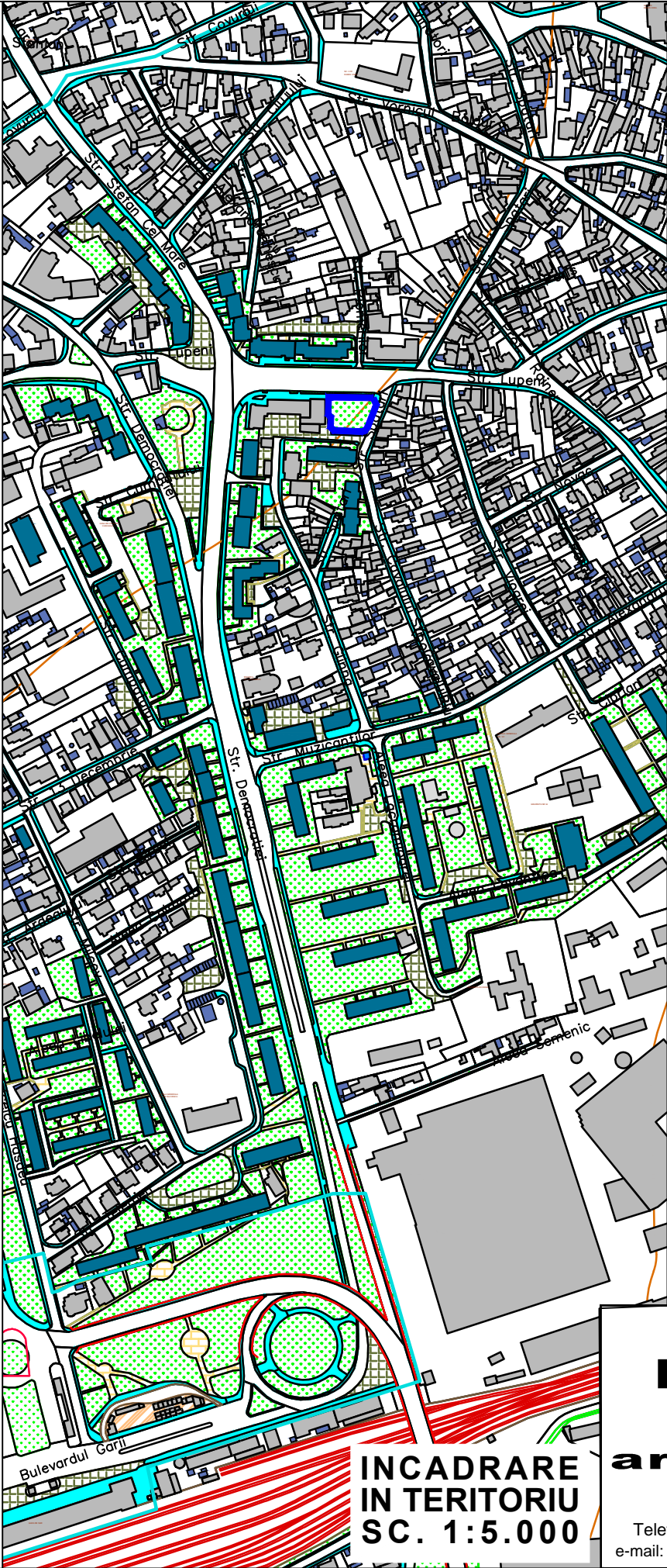
INCADRARE IN TERITORIU SC. 1:5.000