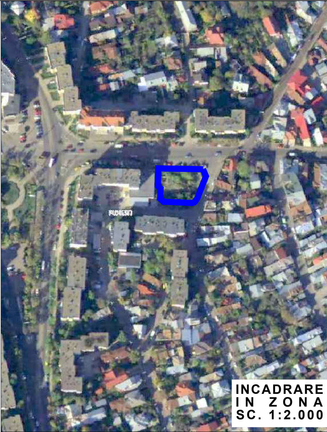
INCADRARE IN ZONA SC. 1:2.000